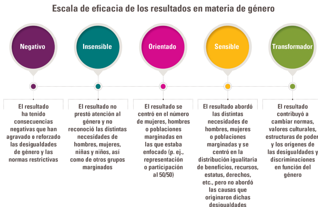
Figura 2. Escala de eficiencia en materia de género